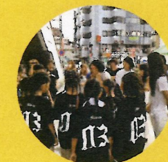
仲間との笑顔は青春